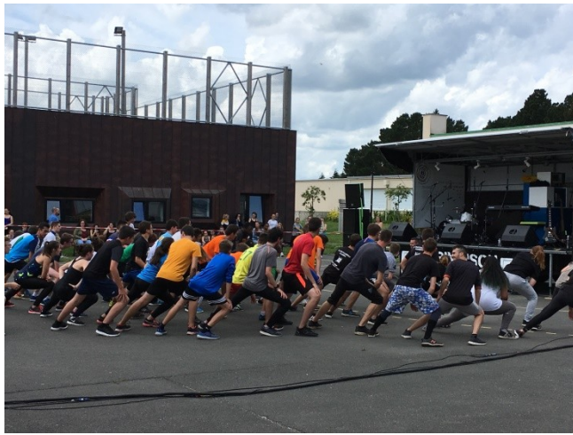
Animation lors de la fête du lycée

Exemple de sorties, animation et de découvertes