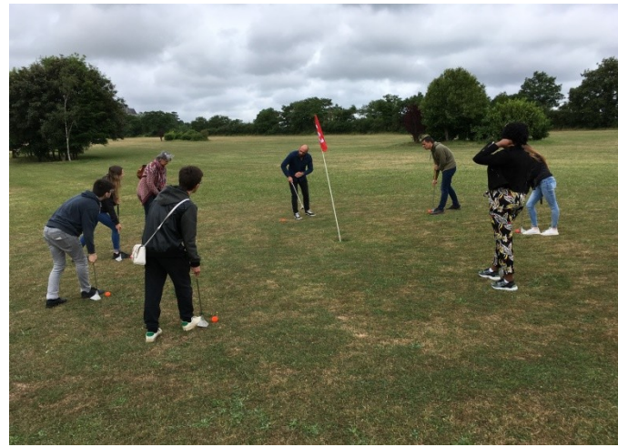
Initiation swing golf