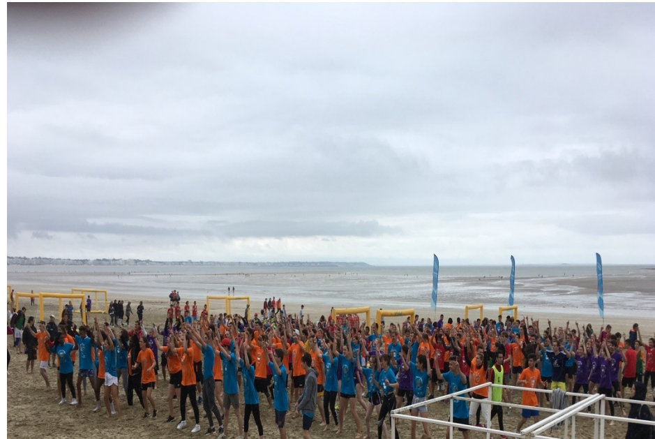
Atlant'lycée dans la cadre de l'AS