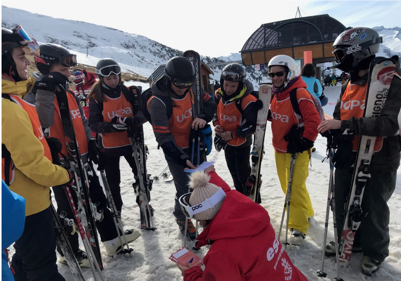
Projet « séjour ski »